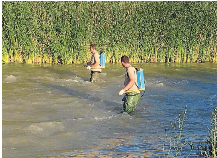
Dos trabajadores de la empresa pública de Monegros aplicando el tratamiento, el año pasado

El tratamiento, que comenzará la próxima semana, se aplicará en 14 municipios situados en las riberas de los ríos Flumen y Alcanadre (Albero Bajo, Sangarrén, Barbués, Torres de Barbués, Almuniente, Grañén, Poleñino, Lalueza, Sariñena, Albalatillo, Huer-