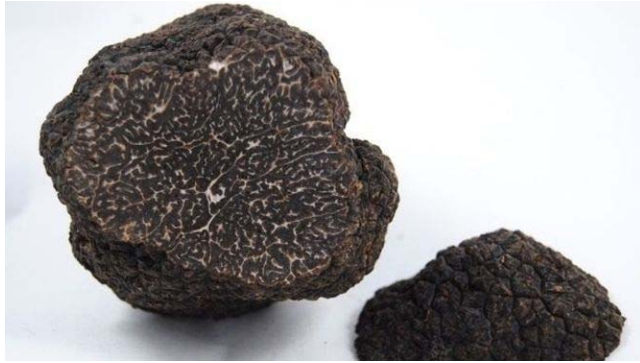
El CITA trabaja en una investigación sobre la calidad de las trufas. ZARAGOZA | EUROPA PRESS