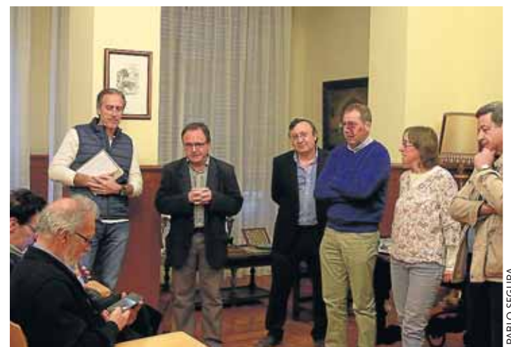
El libro 'Diviértete con las plantas' fue presentado en el Campus oscense por sus autores, en compañía del vicerrector.

La publicación incluye 107 actividades, con fichas ilustradas con imágenes que facilitan su realización, y una introducción con aspectos esenciales de la botánica. ●