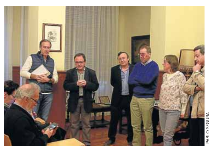
El libro 'Diviértete con las plantas' fue presentado en el Campus oscense por sus autores, en compañía del vicerrector.

La publicación incluye 107 actividades, con fichas ilustradas con imágenes que facilitan su realización, y una introducción con aspectos esenciales de la botánica.