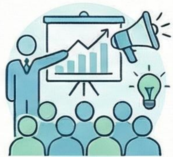
Visibilidad y Formación Colectiva