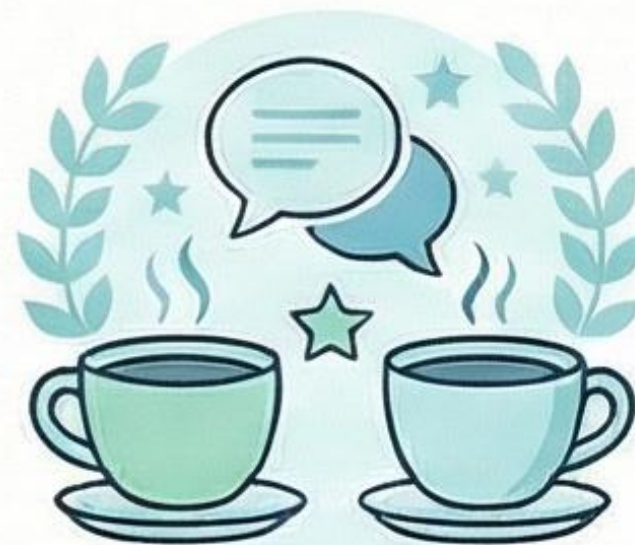
Mentoría "Cafés con Éxito"